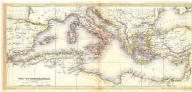
Antiguo mapa del mediterráneo